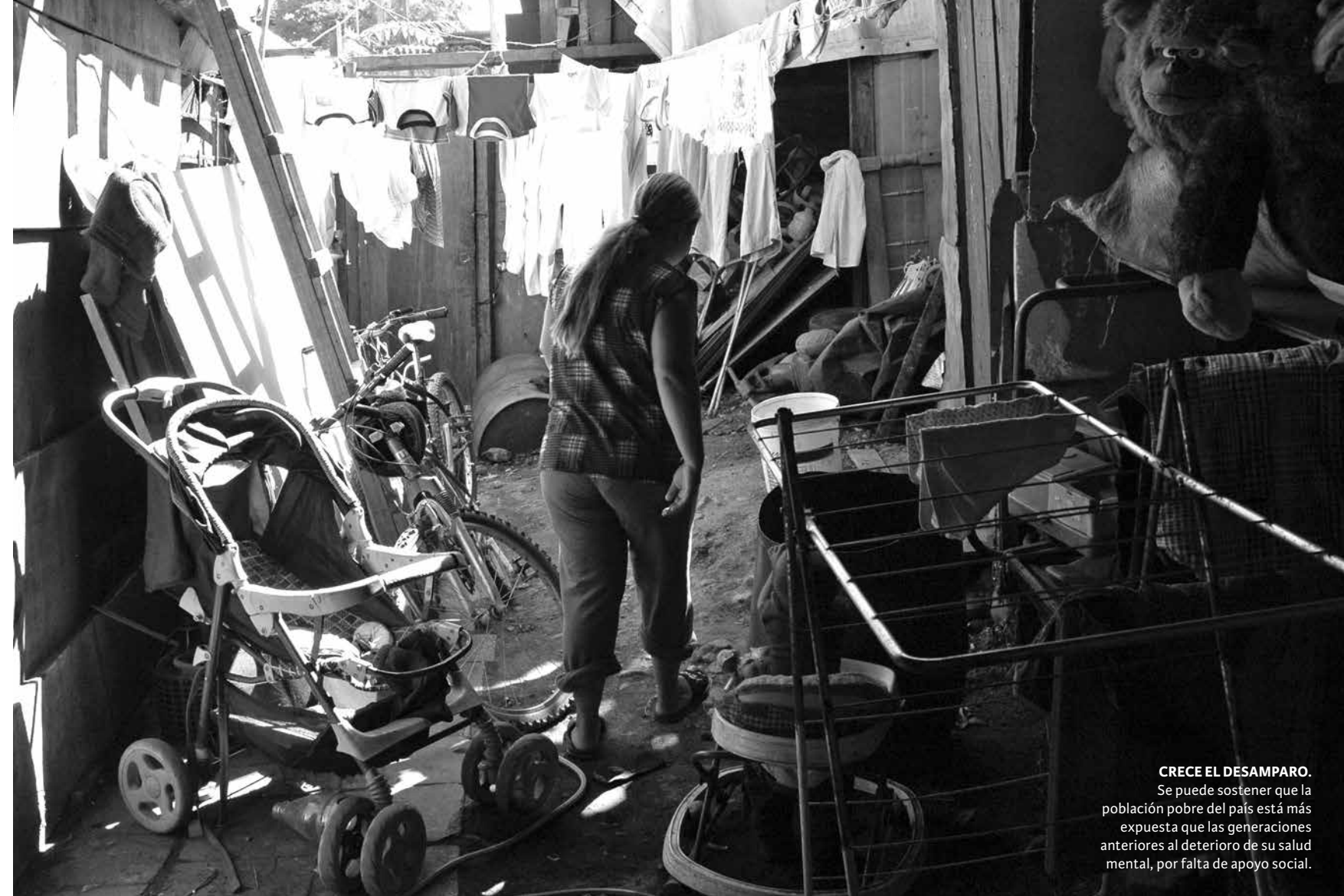
CRECE EL DESAMPARO. Se puede sostener que la población pobre del país está más expuesta que las generaciones anteriores al deterioro de su salud mental, por falta de apoyo social.

Así, estudios tanto nacionales como internacionales muestran que el debilitamiento de las comunidades y de los lazos sociales se relacionan con mayores índices de depresión. Esto porque el compromiso con proyectos comunes permite proteger a las personas de esta enfermedad al enfrentarse a dificultades personales o fracasos. Así, el estilo de vida en Chile, centrado en la competencia y en los logros individuales por